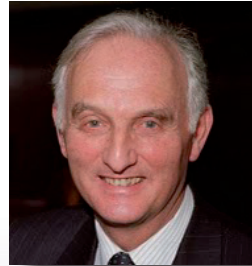
Sir John Houghton